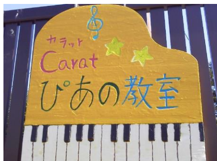
手作り看板（2、3年でボロボロに）